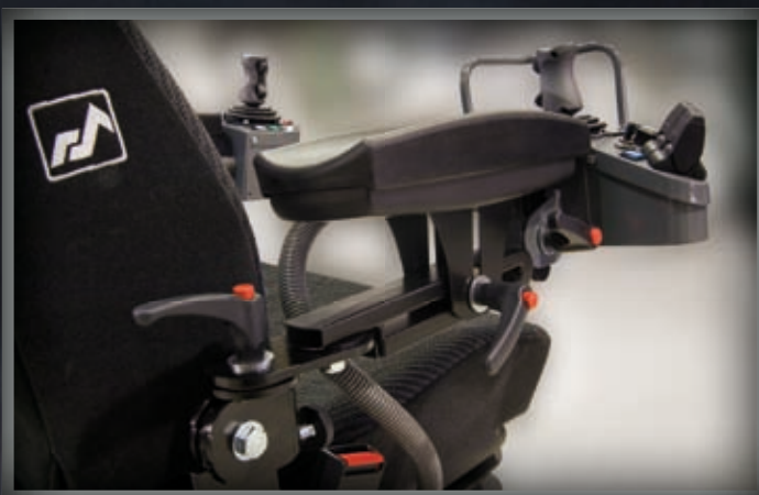
ARMSTÖD OCH SPAKKONSOL LÄTTJUSTERADE