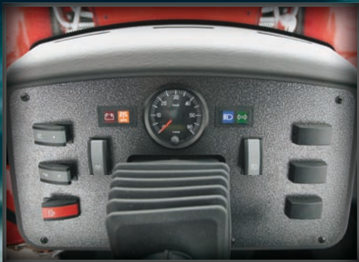
1060B har utrustats med ny frontpanel.