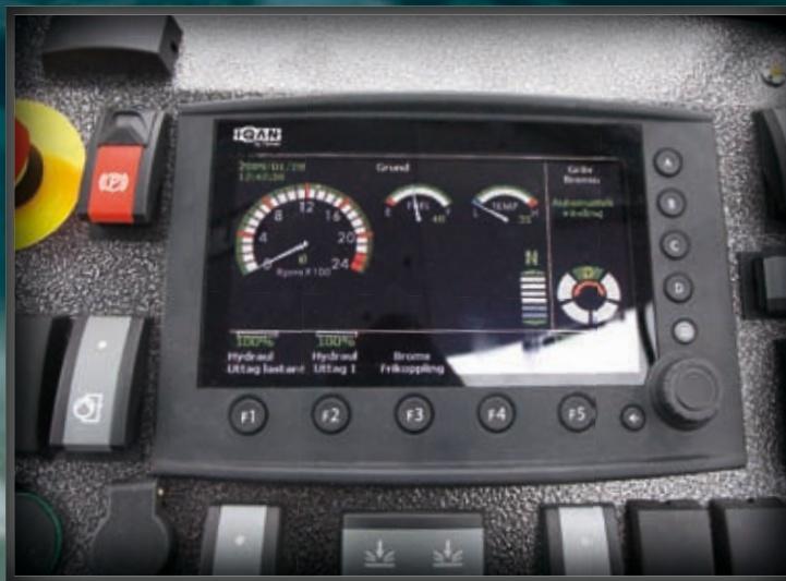
All information om maskinens inställningar och funktioner visas på informationsdisplayen.