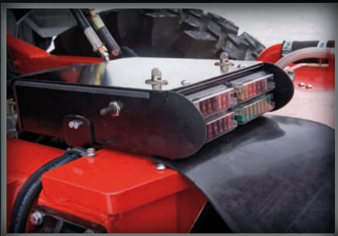
NYTT EL- OCH STYRSYSTEM

Här visas ett axplock av de många nyheter och uppdateringar som gjorts på Huddig 1060B